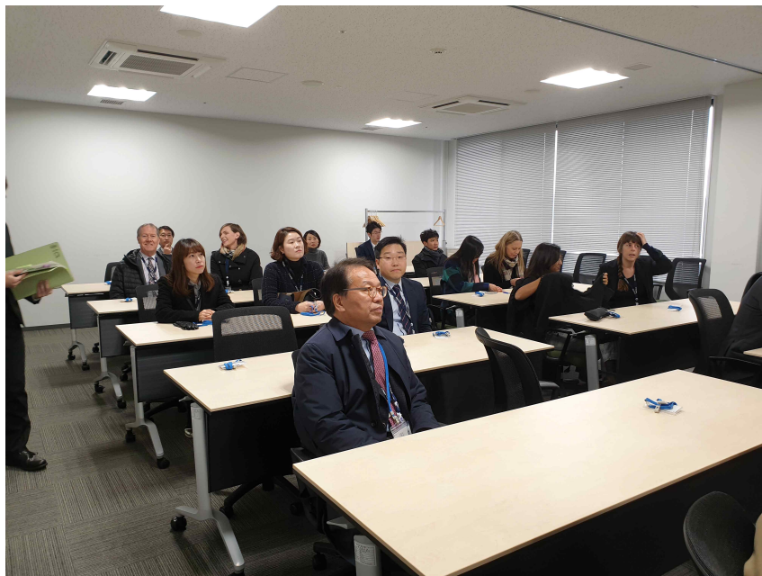
<성인 교정 의료센터 및 교정 연수소 시찰>