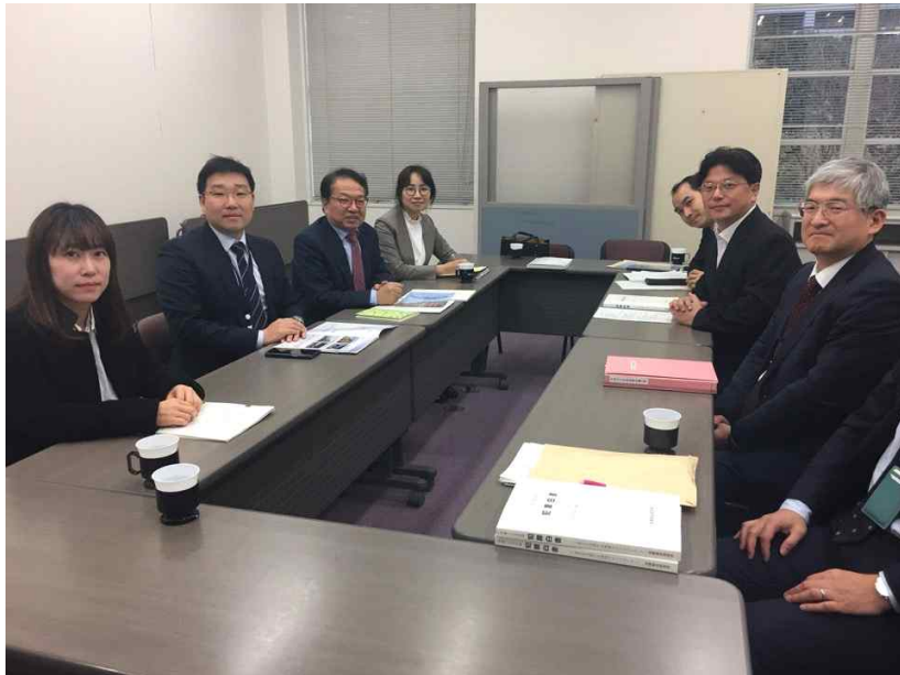
<일본 법무총합연구소 협력 구축 방안 논의>