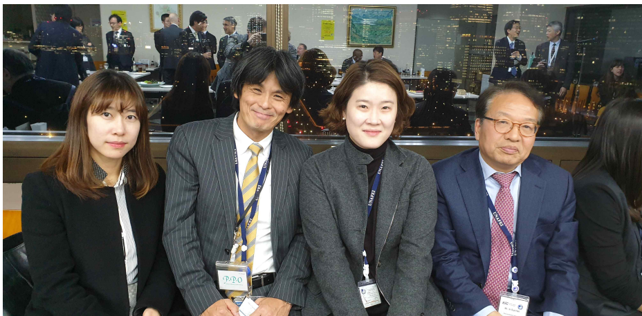
(일본 UNAPEI 행정실장 면담)