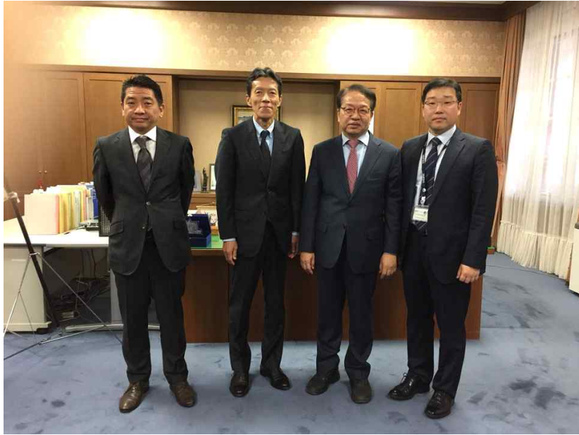
<일본 법무총합연구소 소장 면담>