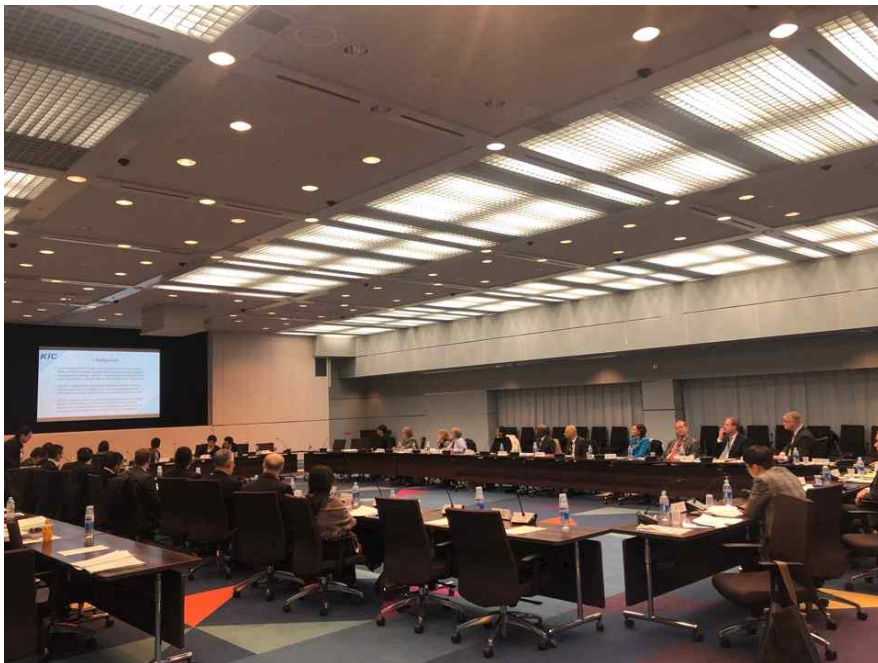
<제14차 유엔범죄예방 및 형사사법 총회 준비 세미나 승재현 팀장 발표>